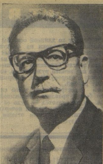
Сальвадор Альенде Госсенс