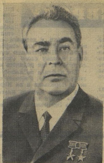
Леонид Ильич Брежнев